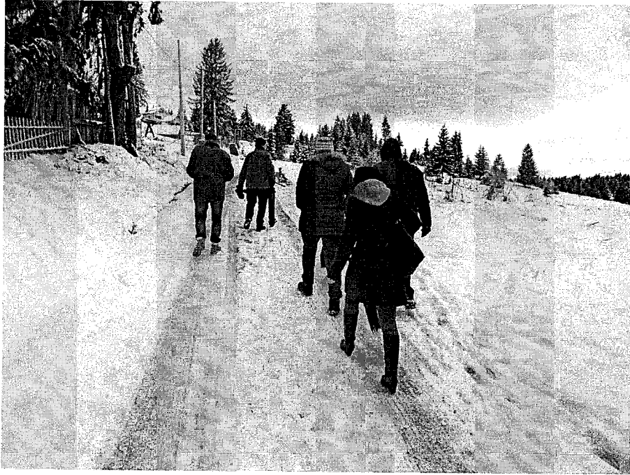
Image 5. Jabuka / Municipality of Prijepolje Visit to rural households in groups